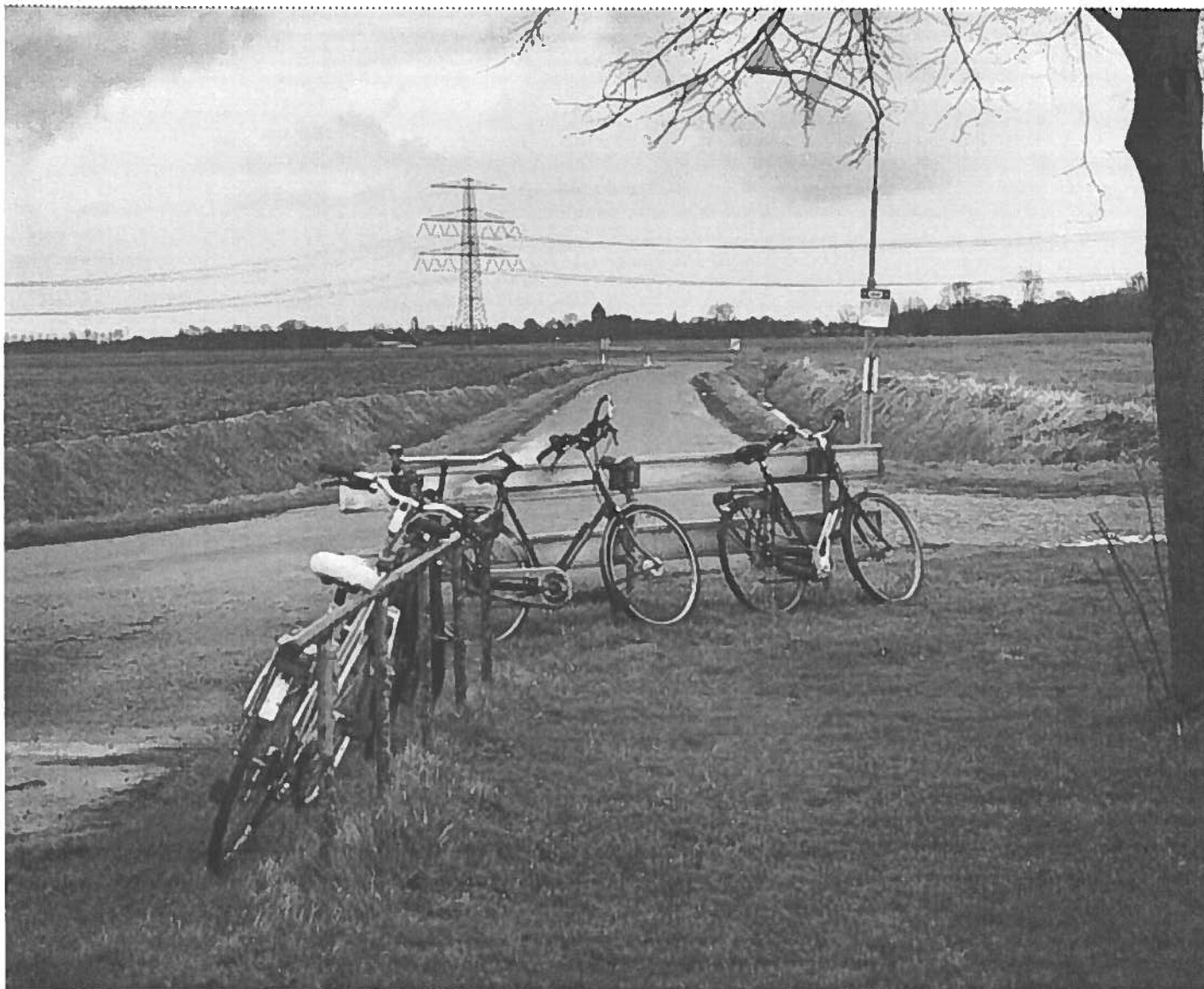
PEPIJN VAN DEN BROEKE / H/H