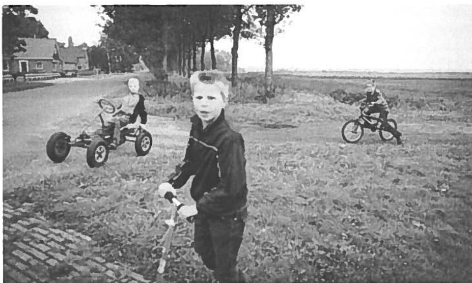
Spelende schooljeugd op straat aan het Noorderdiep in de krimpende plattelandsgemeente Borger Odoorn